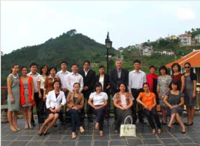
Giảng viên và học viên của khóa đào tạo

Hiệp định Mua sắm chính phủ của WTO có 15 nước là thành viên, trong đó EU được coi là 1 thành viên với 27 nước, và 22 nền kinh tế là quan sát viên của Hiệp định. Việt Nam cũng như nhiều nước đang phát triển khác hiện nay đang xem xét khả năng trở thành quan sát viên