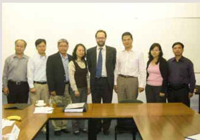
Tiến sỹ Lorand Bartels - giảng viên Đại học King's College - London và các học viên Việt Nam

Vấn đề thương mại và môi trường, dịch vụ và đầu tư, quyền sở hữu trí tuệ, mua sắm chính phủ là những vấn đề ngày càng được đề cập nhiều hơn trong các cuộc đàm phán thương mại trên các diễn đàn đa phương, khu vực và song phương. Nhằm cập nhật kiến thức cho các cán bộ chính phủ- các nhà đàm phán thương mại về các vấn đề nêu trên, Dự án EU-Việt Nam MUTRAP III đã phối hợp với trường đại học King's College - London và Bocconi University - Milan tổ chức Khóa đào tạo 2 tuần về các vấn đề mới trong thương mại quốc tế từ ngày 29/8 đến 9/9/2011 tại London (Anh) và Milan (Italia).